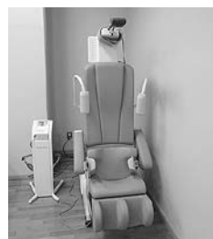
▲能動型自動問欠牽引装置

今後とも、良質な医療サービスの提供と医療環境の整備、地域医療の充実に努めていきます。