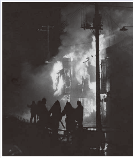
炎上するグリーンハウス

昭和51年10月29日に発生した酒田大火から今年で40年。猛火は繁華街を一夜にして飲み込み、3,300人もの罹災者を出しました。大火復興地に開設された当館では、開館以来市民の皆さんの協力を得て、大火の記憶を次の世代につなげるべく資料を集め保存しています。本企画展では、当時の写真や当館所蔵の遺物など貴重な大火資料を展示します。