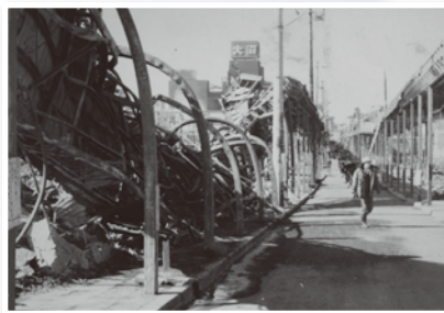
アーケードの焼け跡

会期／10月29日(土)～平成29年1月29日(日) 休館日／ 【10月、11月】無休 【12月、1月】月曜日休館(祝日の場合は翌日休館) 【年末年始休館】12月29日(木)～平成29年1月3日(火) 開館時間／午前9時～午後4時30分 入館料／大人100円、学生50円 (土曜・日曜日は小中学生無料) ◆11月3日(祝)は入館料無料。