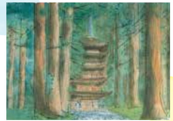
《羽黒山神社五重塔》水彩画 1997年

観覧料 一般900円、高校生450円、中学生以下無料 ◆詳しくは同館ホームページを参照してください。