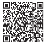
▲申し込みフォーム

8時▼場所／サンロクまたはZOOMによるオンライン▼対象／好きなことや得意なことを活かして楽しく働きたい50歳代までの女性(オンラインは男女問わず参加可)▼定員／会場15人▼内容／整理整頓術を身につけて、仕事もプライベートも楽しむコツを学ぶ ▼講師／Rita(リッタ) スタンツァ Stanza代表 中山真由美氏(オンラインによる出演) ▼費用／無料▼申し込み／7月22日(金)午後5時まで右記申し込みフォームから