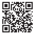
▲セミナーホームページ

対象／家事や育児、本業の合い間に学び、仕事につなげたい市内在住の女性▼定員／先着30人▼費用／無料▼持ち物／スマートフォンまたはタブレット端末、筆記用具▼申し込み／7月6日(水)午後5時まで左記二次元コードから必要事項を入力