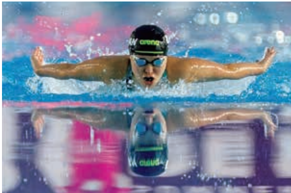
▲本人も一番自信があると話すバタフライ