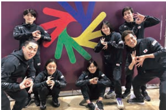
▲水泳日本代表の選手たちとともに