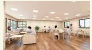
1階パブリックスペース (イメージ)