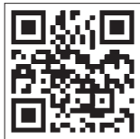
▲まいふれ酒田ホームページ