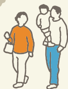
●山形県立酒田東高等学校