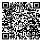
▲光の湊 ホームページ

酒田駅前夏まつり 日時／8月27日(土) 午後2時～9時 場所／ミライニ広場 内容／縁日、宝探し、浴衣ファッションショー、 抽選会、キッチンカー、ビアガーデンなど 対象／どなたでも ◆飲食物の購入はチケット制となります。 中央図書館 クリーンサービス(株)内 酒田駅前地区活性化協議会事務局 ☎22-5050