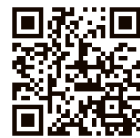
▲超異分野学会ホームページ