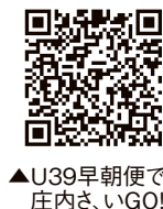
▲U39早期便で 庄内さ、いGO!

搭乗対象期間／令和5年3月15日 (水)まで▼助成額／片道利用5千円、 往復利用1万円▼対象／次の全て の要件を満たす方・39歳以下の方 ・早期便(ANA393便、394便) を利用した方・県内への移住希望 相談または就職活動を行った方 ◆詳しくは下記 二次元コード を参照してくだ さい。