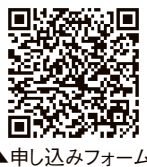
▲申し込みフォーム

日時／10月22日(土)午後1時～3時▼場所／公益研修センター(オンラインもあり)▼対象／家庭でも人間力をアップしたい方▼定員／「会場」先着50人「オンライン」制限なし▼内容／今どきの「家庭科教育」を通して家族の役割分担を振り返り、日々の生活を豊かにするヒントを知る▼講師／山形大学名誉教授 高木直氏▼持ち物／筆記用具▼費用／無料▼申し込み／10月18日(火)午後5時まで下記申し込みフォームから、または市男女共同参画推進センター・ウイズへ ☎2615616、✉with@city.sakata.lg.jp ◆託児あり(満1歳～就学前児童1人500円)。10月14日(金)までウイズへ申し込んでください。