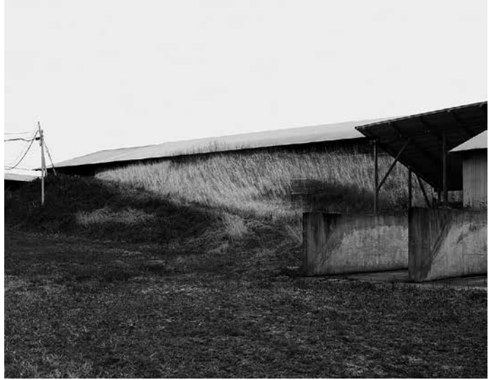
北島敬三《飯館村 福島県 2011年10月13日》

会 期 / 10月20日(木)~令和5年1月15日(日) 開館時間 / 午前9時~午後5時(入館は午後4時30分まで) 入 館 料 / 一般700円(550円)、高校生350円(280円)、 中学生以下無料 ◆( )内20人以上の団体割引。 休 館 日 / 【10月~11月】無休 【12月~1月】月曜日(祝日の場合は翌日)