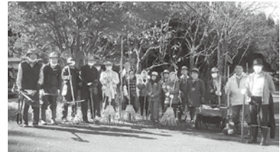
鳥海やわたインタープリター協会 [自然保護・地域振興]

本団体は、鳥海国定公園区域内外で、観察会などの活動を通じ、人と自然との関わり方や自然保護の理解を深め、地域の振興と発展、自然環境の保全への寄与を目的に、平成12年に設立されました。会員には多様な分野に精通した人材が集い、知識や経験を共有し研鑽を積み重ねています。 市内小学校自然体験教室の受け入れ、野草観察・スノートレッキングなどの四季折々の誘客事業、環境省猛禽類保護センターと連携した調査事業、八森自然公園清掃活動など多岐にわたる地域活動を継続されております。