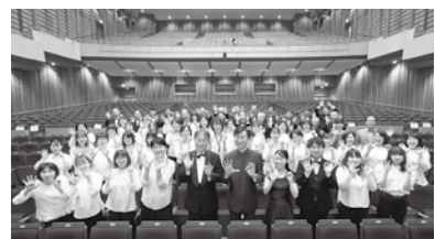
酒田吹奏楽団 [音楽]

本団体は、地域の音楽文化の発展に寄与することを目的に発足され、10代から60代までの団員60余名で、日々高い目標を持ちながら活動しております。 各種福祉施設への「ボランティア訪問演奏事業」に取り組みられ、地域に根差した楽団としての役割を果たす「公益演奏事業」として、大型船の寄港歓迎セレモニー、街角コンサート、商店街のまつりなどにも積極的に参加してこられました。 中高生の指導にも積極的に取り組まれ、次世代の音楽文化を担う人材の育成にご尽力されております。