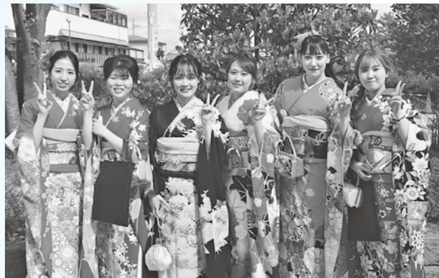
令和4年 酒田市成人式

期 日 / 令和5年1月8日(日) 場 所 / 希望ホール 対 象 / 本市在住または本市出身の平成14年4月2日～平成15年4月1日生まれの方 申し込み / 12月26日(月)まで右記二次元コードより