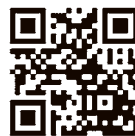
▲水泳教室ホームページ

期間／12月1日(木)～令和5年2月25日(土)▼場所／光ヶ丘プール▼対象／医師から運動制限されていない、または健康指導や運動を勧められている成人▼内容／水泳・アクアウォーキング・アクアビクスから選択▼費用／4回分チケット3千円、8回分チケット5千500円▼申し込み／11月17日(木)午前11時～費用を添えて光ヶ丘プール内同教室窓口へ、または ☎33-0167