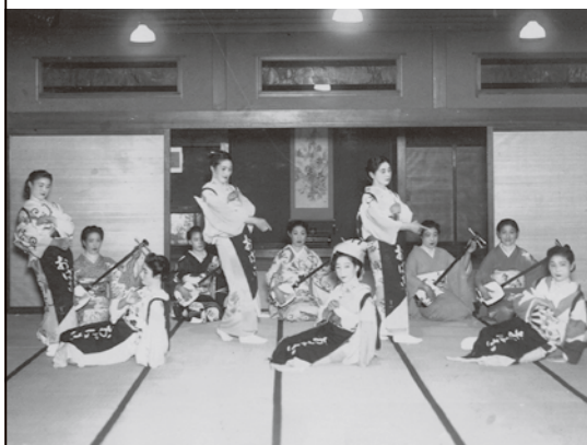
料亭の座敷で「庄内おぼこ」を踊る芸妓 / 昭和

総人口 / 97,606人 世帯数 / 42,667(15) 男 46,724人(38) 女 50,882人(53) [令和4年10月31日現在] ( )内は対前月増減数。