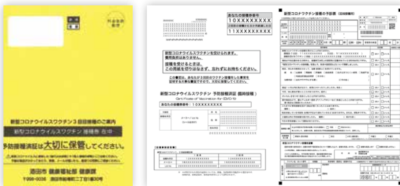
▲予診票と一体となった接種券

A3 2回目接種完了から原則8か月（医療従事者など／6か月、高齢者／7か月）が経過した方へ順次、予診票と一体となった接種券などの書類を郵送します。黄色の目立つ封筒に入っていますので、接種を希望する場合は必ず確認し、無くさないようにしてください。