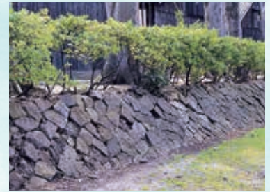
▲土盛りをした時の石垣も残っています。