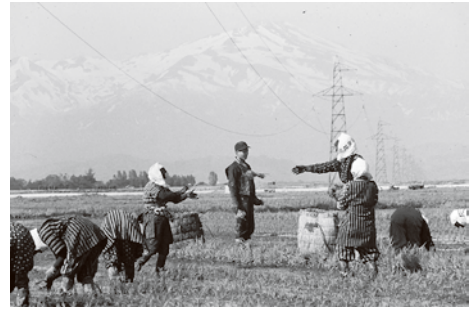
昭和30～50年代撮影の田植え風景

日 時 / 7月23日(土)・30日(土) 午前10時～(各1時間程度) 会 場 同館1階企画展示室 定 員 / 各10人 費 用 / 無料(入館料別途) 申し込み / 6月25日(土)～同館へ