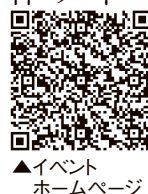
▲イベントホームページ