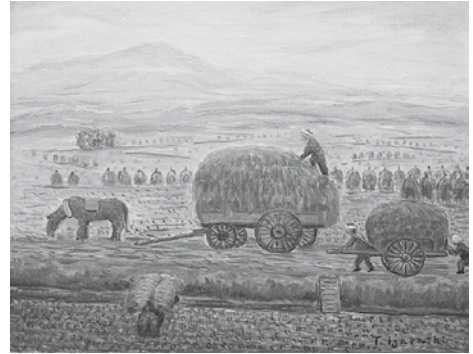
五十嵐豊作画「晴れた日の稲揚げ風景」