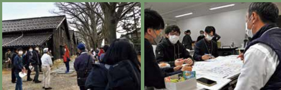
▲ワークショップでは、実際に山居倉庫を見学した後、それぞれの感想や活用のアイデアなどを出し合い、意見交換しました。

来年度以降も、市民の皆さんと一緒に山居倉庫について学んだり、考えたり、保存活動を行う機会を予定しています。