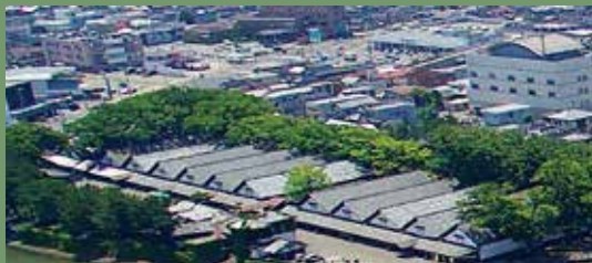
▲上から見ると、木と木の間隔がかなり密になっており枝も重なっていることがわかります。

市では樹勢回復のため、早急に石畳の撤去やケヤキの剪定、土壌改良、表層部への影響が少ない遊歩道の整備などを進めていきたいと考えています。