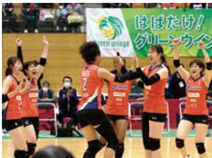
▲選手同士のコミュニケーションを大切にし、チーム力で戦う「全員バレー」もアランマーレの持ち味。