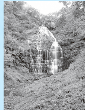
檜山滝(由利本荘エリア)

檜山滝は、鳥海山の北東(由利本荘市鳥海町下直根)に位置し、柱状節理が階段状になっている急崖を流れ下る落差50mほどの滝です。檜山滝の水は沢内沢川となり、直根川を介して子吉川に流入します。