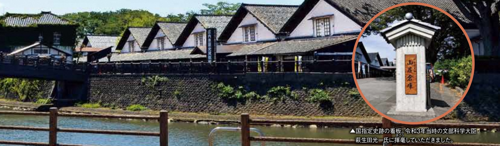
▲国指定史跡の看板。令和3年当時の文部科学大臣萩生田光一氏に揮毫していただきました。