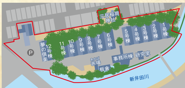
▲倉庫だけでなく、事務所棟、東宮殿下行啓記念研究室、板倉、赤場、三居稲荷神社、ケヤキ並木、新井田川護岸の石垣も重要な構成文化財として史跡に含まれています。

保存活用計画／山居倉庫の価値や課題を整理し、保存や活用の方向性を定める基本的な計画。 整備基本計画／保存活用計画で定めた範囲内で、より具体的にどう活用していくか、どこまで整備するのかを定める計画。