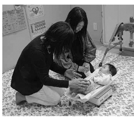
▲体重や身長計測もできます(要予約)

子育ての不安や悩みはつきないもの。ひとりで抱え込まずに相談してみませんか。 市役所1階のこども家庭センター「ぎゅっと」では、妊娠から子育てまでに関わる不安や悩みの声に寄り添い、関係機関と連携して支援します。 相談は、来所のほか電話やメールでも受け付けています。また子ども本人からの相談もできます。 ◆プライバシーに配慮し、個室で相談することができます。