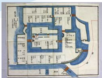
亀ヶ崎御城内之図(嘉永2年)

入 館 料 / 一般200円、高校生90円、小中学生50円 (土曜・日曜日は市内小中学生無料)