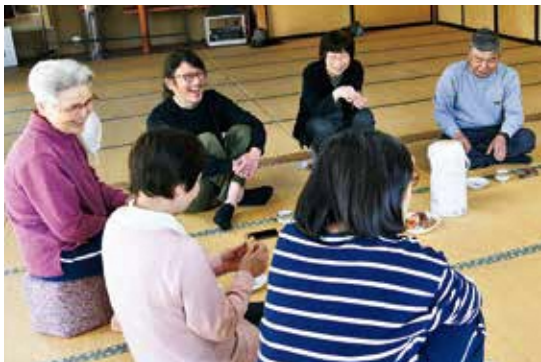
▲5月の「内郷100歳体操」では、いちごが丸ごと入った手作りようかんを提供。おしゃべりが弾みます。