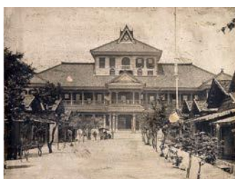
琢成学校の写真(明治時代)

館藏品展の第二弾として、江戸時代の酒田の絵図、 明治から昭和にかけての中心市街図、明治・大正時代の 古写真など、酒田の歴史を伝える資料を展示します。