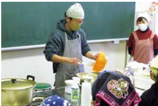
▲内郷地区食生活改善推進員に誘われて、デザート部門の講師として親子向けの料理教室に参加。