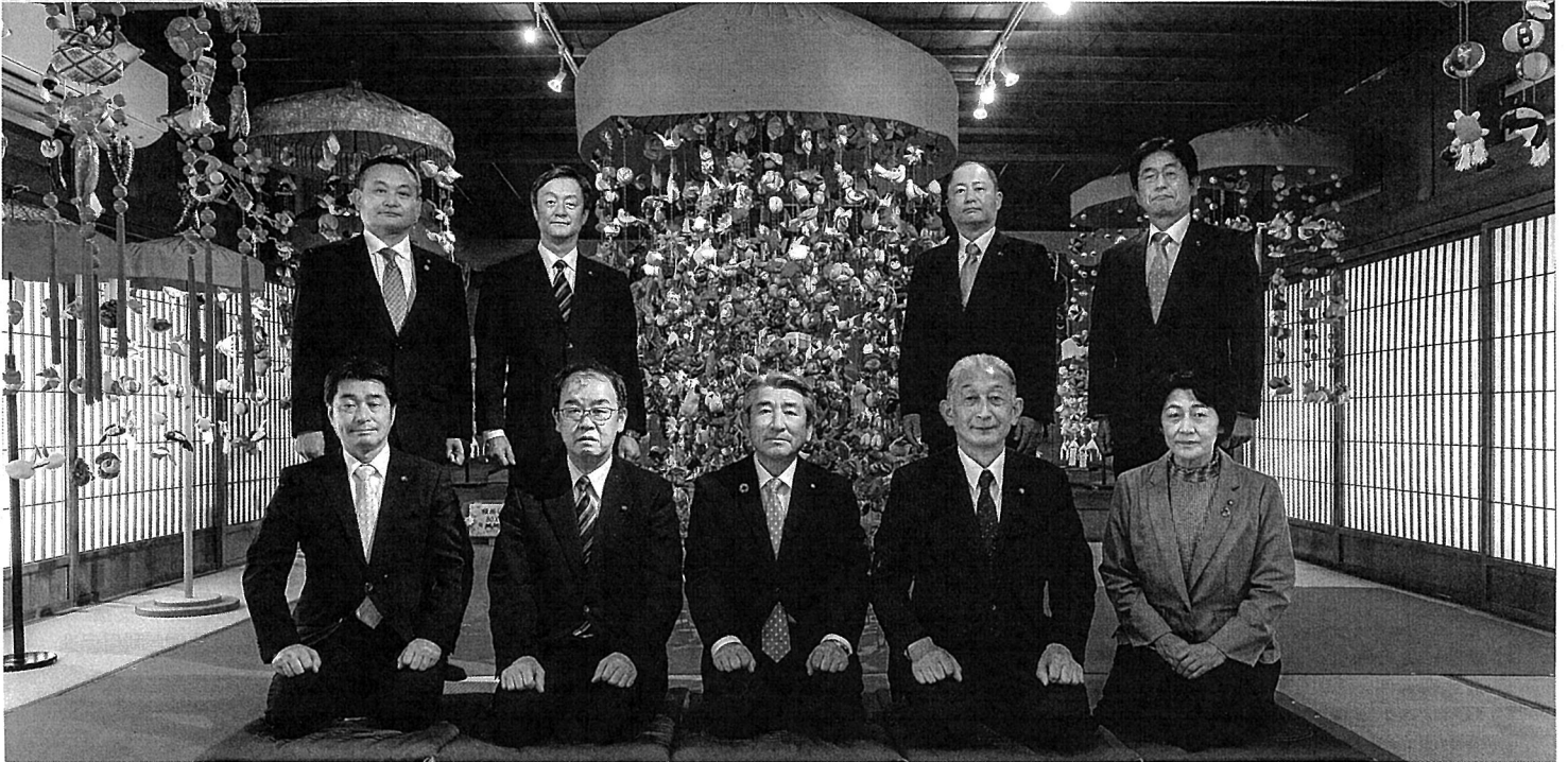
山王くらぶ 酒田雛街道