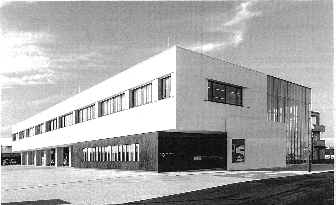
令和3年11月25日に業務開始した新消防本部・本署庁舎