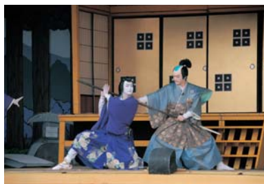
次世代に伝える伝統芸能（黒森歌舞伎）

本市には、各地域に長年受け継がれてきた優れた歴史、文化遺産が多くあります。その価値を見つめ直し、新たな資源を掘り起こしながら、市民共有の財産として次世代に継承し、発展させるとともに、地域の個性を高め合うまちづくりを推進します。