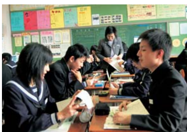
自ら考え生きる力を育てる

子どもたちが夢あふれる未来に向かって、健康で心豊かにたくましく成長していく姿は、すべての市民の願いです。明日を担う酒田っ子が、広い「かかわり」の中で「公益の心」、他への思いやりの心を持ちながら、自ら学び、自ら考える「ちから」が育まれるよう家庭や学校、地域が一体となって教育内容や教育環境を充実します。