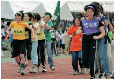
健康スポーツ・レクリエーションの普及

社会の変化が急速に進み、市民の生活意識や価値観が多様化している時代にあって、健康で心豊かに充実した人生を送るために、「いつでも」「どこでも」「だれでも」気軽に生涯学習、スポーツ・レクリエーション活動に参加できる環境を整備します。また、学んだ内容や成果を自ら進んで地域社会に還元できる人づくりを進めます。