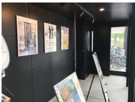
内観（奥側から入口方向）