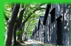
国指定史跡「山居倉庫」

【問い合わせ】酒田市 総務部 人事課 電話 | 0234-26-5703 E-mail | jinji@city.sakata.lg.jp