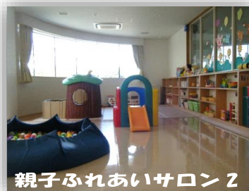
親子ふれあいサロン2