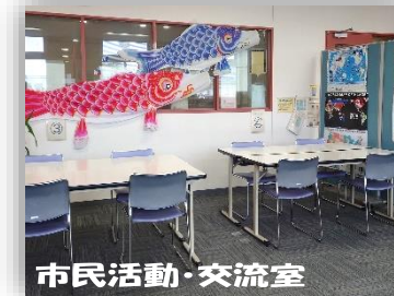
市民活動・交流室