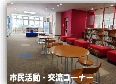
市民活動・交流コーナー