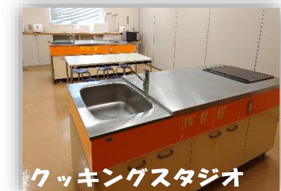
クッキングスタジオ