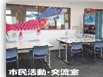
市民活動・交流室