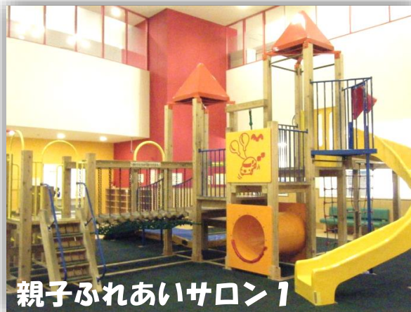
親子ふれあいサロン1