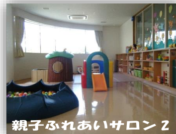
親子ふれあいサロン2