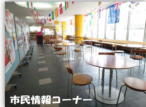
市民情報コーナー