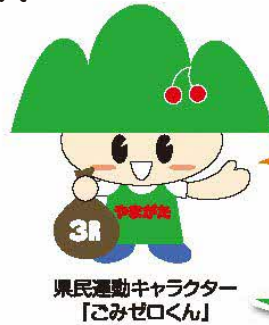
県民運動キャラクター 「ごみゼロくん」

食品ロス削減国民運動キャラクター「るすのん」 ※食品ロス…食べられるのに捨てられてしまう食品