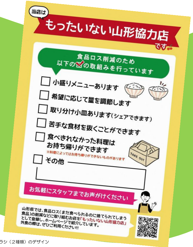
※POPスタンド挿入用チラシ(2種類)のデザイン