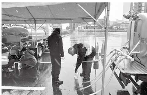
▲地域住民への給水活動（七尾市）

期間／1月27日(土)～31日(水) ▶ 内容／職員1人 ▶ 支援自治体／新潟市